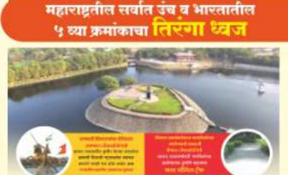
महाराष्ट्रातील सर्वात उंच व भारतातील ५ व्या क्रमांकाचा तिरंगा ध्वज