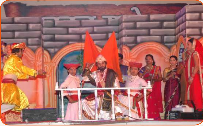
अवघा लोकरंग महाराष्ट्राचा