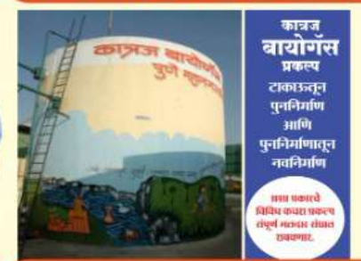
कात्रज वायोगस प्रकल्प टाकाउत्तल पुननिर्माण आणि पुननिर्माणाला नवनिर्माण