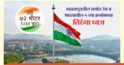
उंची ७२ मीटर (२३४ फूट) महापट्टातील सर्वात उंच व भारतातील ५ व्या क्रमांकाचा तिरंगा ध्वज