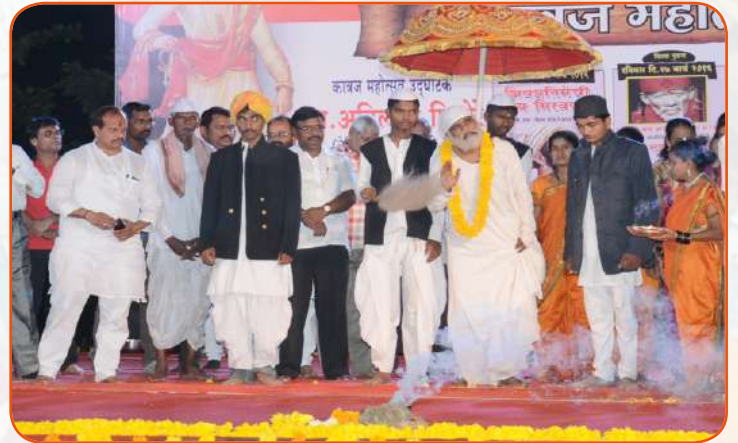
साई सप्तसुर (साईबाबांची भक्तिगीते)