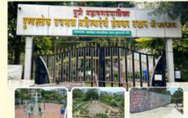
दक्षिण पुण्यातील सर्वात मोठे पुण्यश्लोक अहिल्यादेवी होळकर उद्यान