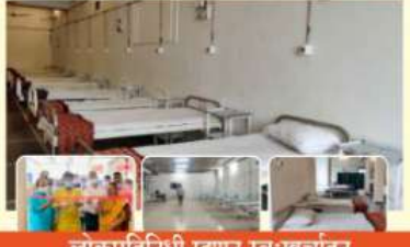
लोकप्रतिनिधी म्हणून स्वःखर्चातून पहिले कोव्हिड सेंटर