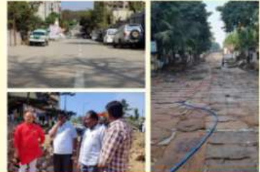
दक्षिण पुण्यातील सर्वात मोठा डि.पी.रस्ता कोंक्रीटीकरण