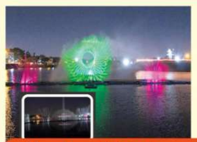
कारंजे व लेझर शोचे विहंगम दृश्य