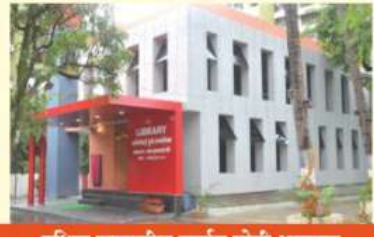
दक्षिण पुण्यातील सर्वात मोठी अद्यावत सायब्रीवाई फुले अभ्यासिका