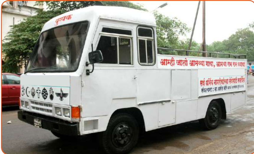
'पुष्पक' - शववाहिनीची निर्मिती